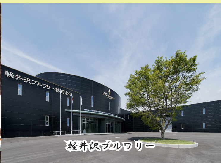
軽井沢ブルワリー