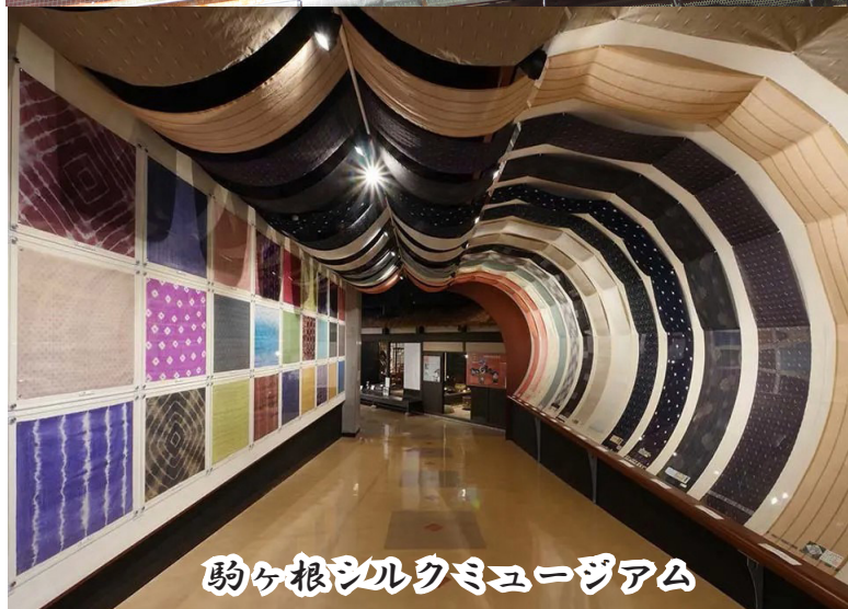
駒ヶ根シルクミュージアム